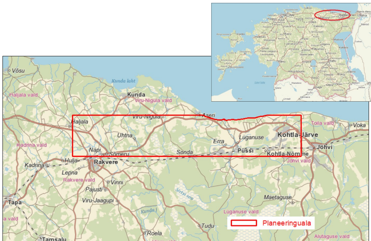
Joonis 3. Planeeringuala piir. Aluskaart: Maa-amet

Haljala–Kukruse trassi esialgne planeeringuala on määratud ulatuses, mis võimaldab eriplaneeringu koostamisel kaaluda trassi alternatiivseid asukohti. Planeeringuala piiri ettepanek on esitatud Joonis 3. Planeeringuala suurus on ligikaudu 67 000 ha.