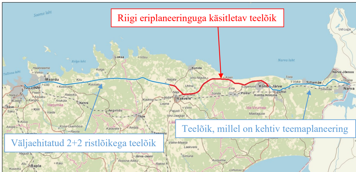
Joonis 1. Põhimaantee 1 Tallinn–Narva olemasolev olukord. Aluskaart: Maa-amet